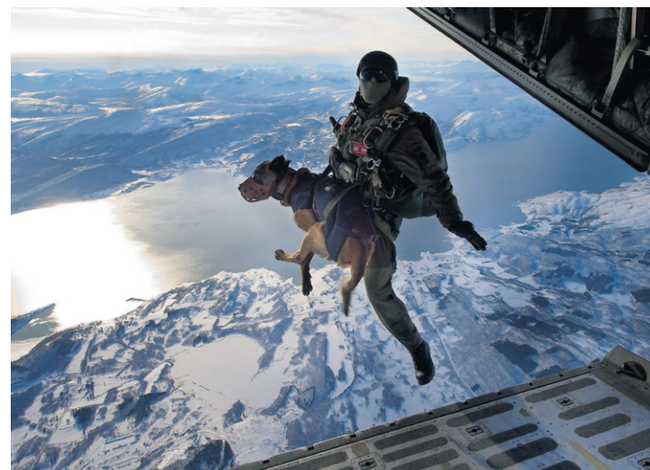
Her springer en østrigsk kommandosoldat på opgave ud fra et fly med sin specialtrænede hund.