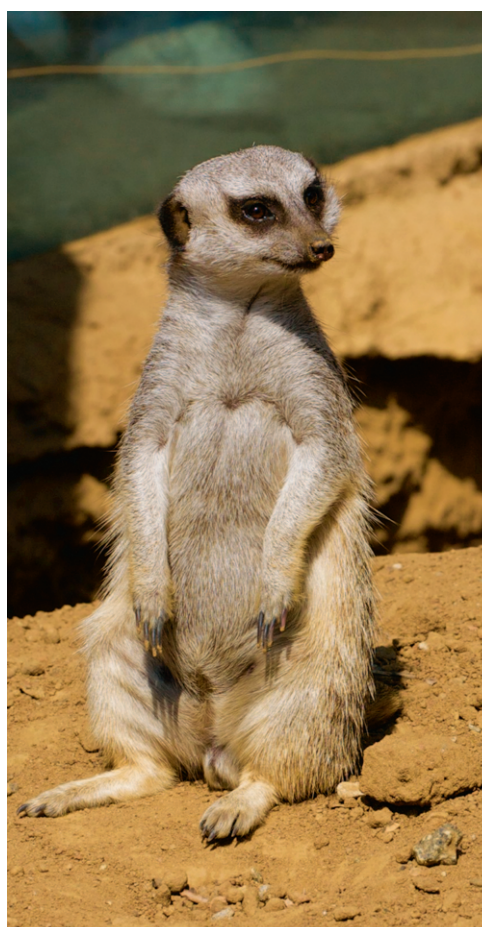
Det kælnes desmerdyret – en af kommandosoldaternes bedste venner i junglen.

Du har sikkert hørt om det danske forsvars jægersoldater og frømand. De er i fysisk topform og har en lang, specialiseret uddannelse bag sig. Under Anden Verdenskrig blev den slags elitestyrker ofte kaldt for kommandosoldater. Især englænderne brugte dem meget, ikke mindst mod tyskerne i de besatte lande i Europa. En af de kendteste kommandosoldater var dansker. Han hed Anders Lassen og blev dræbt i 1945, kun 24 år gammel.